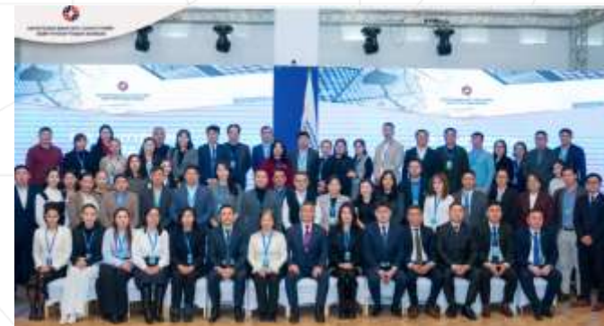
МББСБ-ын бүх гишүүдийн хурал