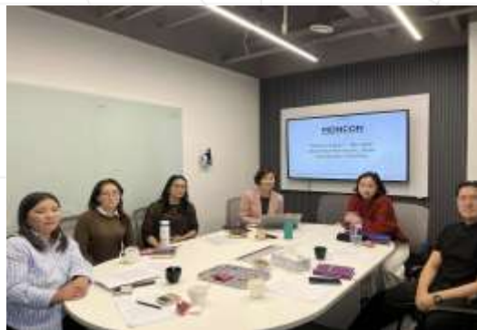
Шинэ ажилтны сургалт