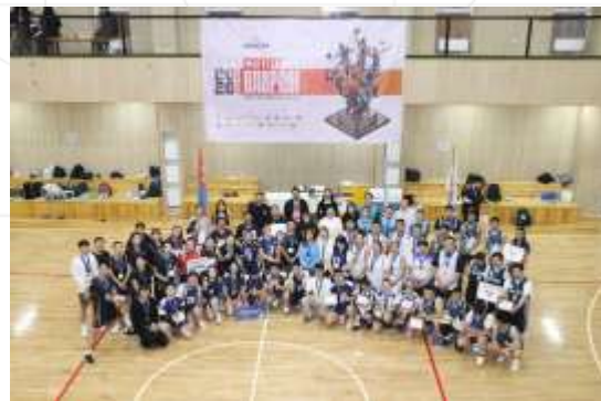
Спортын арга хэмжээ